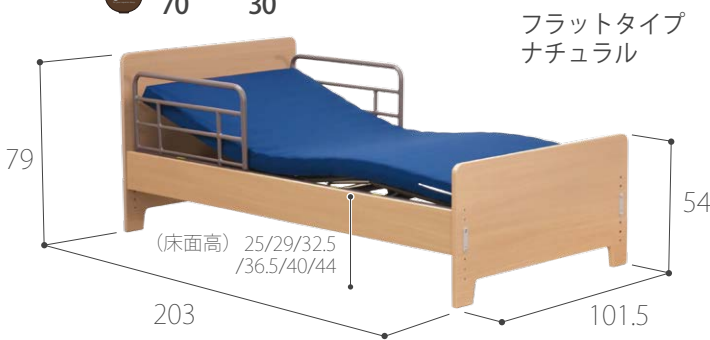
フラットタイプ ナチュラル