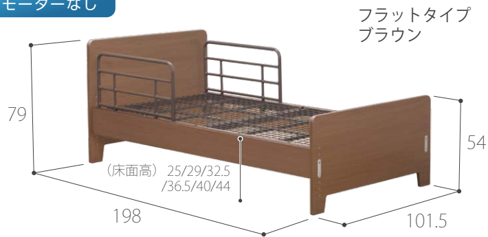
フラットタイプ ブラウン

ヘッドボード、ボトム、カラーを用途に応じて、 様々なバリエーションからお選びいただけます。