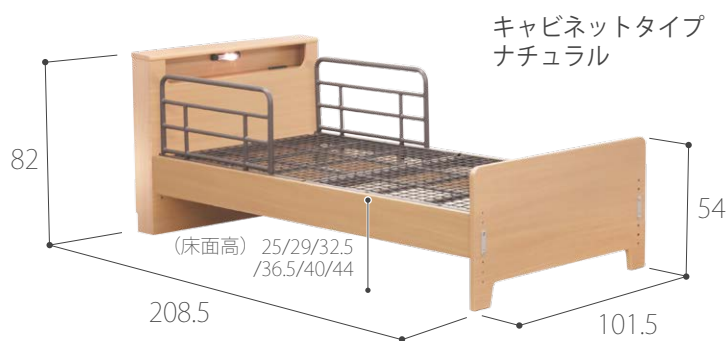
キャビネットタイプ ナチュラル

ヘッドボード、ボトム、カラーを用途に応じて、 様々なバリエーションからお選びいただけます。