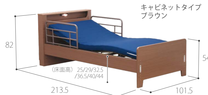
キャビネットタイプ ブラウン