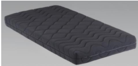
ブラック色 (S)サイズ