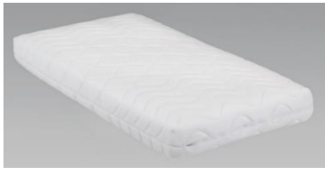
ホワイト色 (S)サイズ