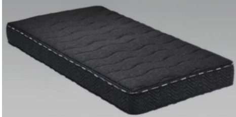
ブラック色 (S)サイズ