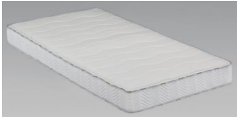
ホワイト色 (S)サイズ